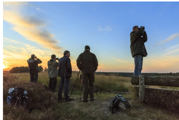
Komt dat zien: wilde dieren bij Natuurmonumenten

Overigens blijft het nodig om delen van gebieden af te sluiten voor wandelaars en fietsers, zodat dieren in alle rust hun jongen kunnen groot brengen. De enquête maakt duidelijk dat de achterban daarvoor veel begrip heeft.